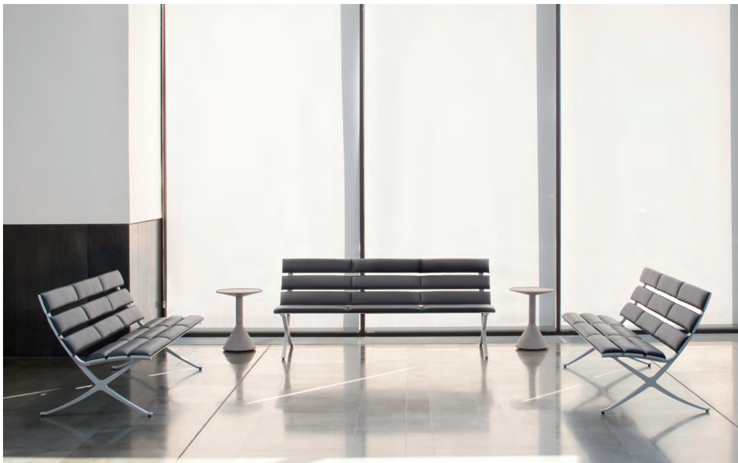
Unten, Ensemble Bench B und Side table B.