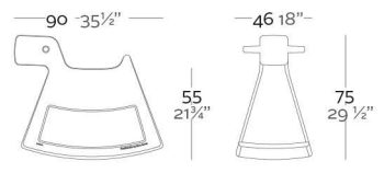
ROSINANTE Rocking Chair ROSINANTE Balancín

ReferenceX, for example 0000A ReferenciaX, ejemplo 0000A.