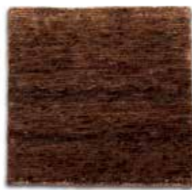
Marrón / Brown