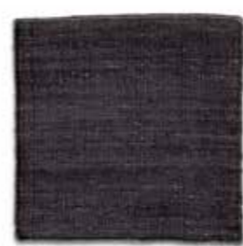
Negro / Black