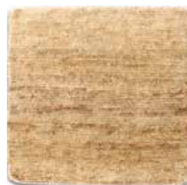
Natural / Natural