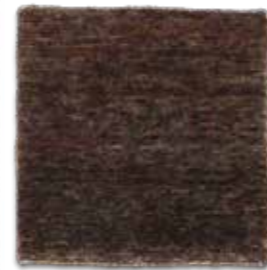
Negro / Black