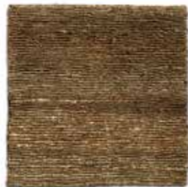
Caqui / Khaki