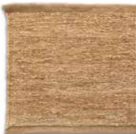
Natural / Natural