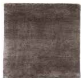
Gris pardo / Taupe