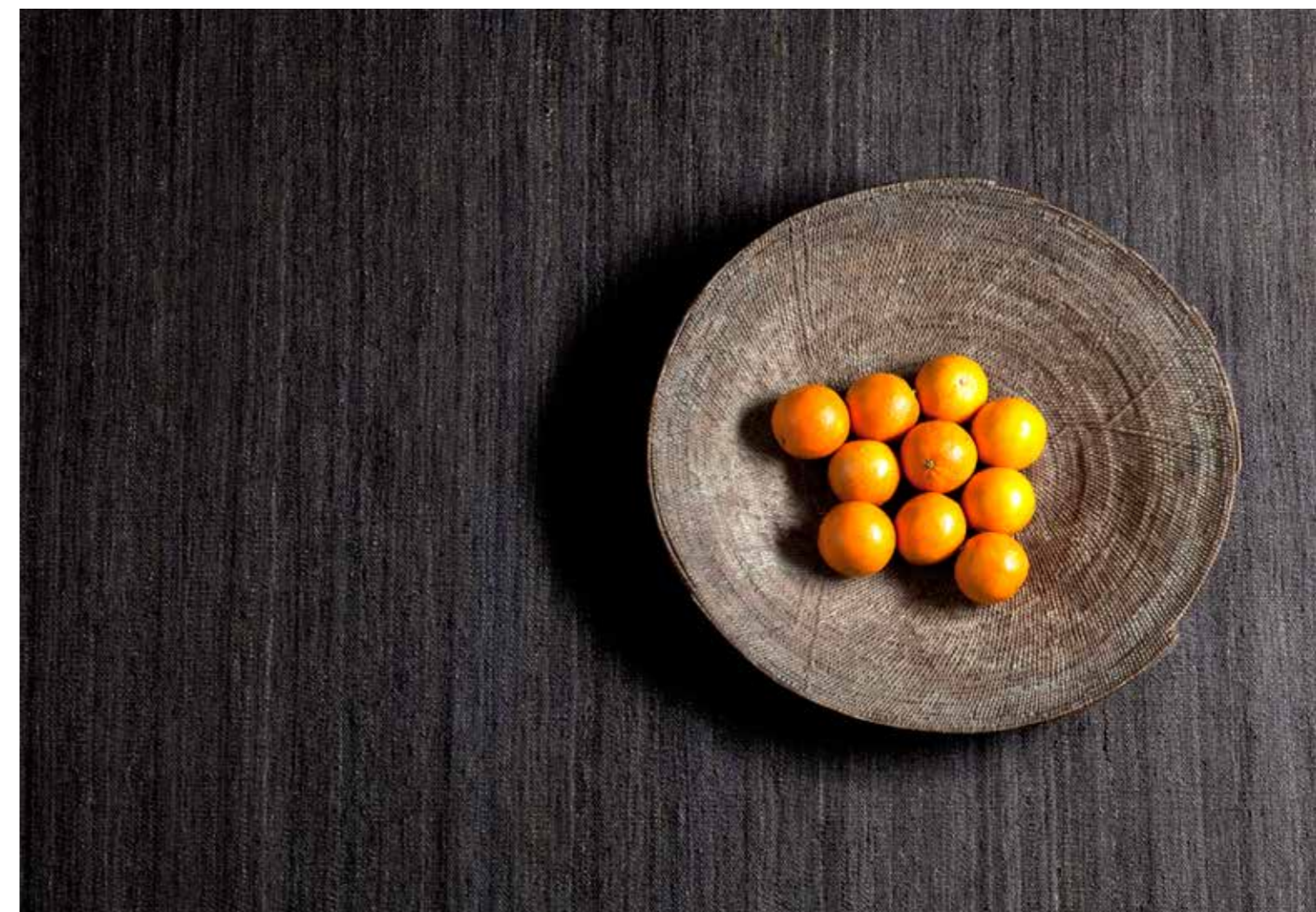
Negro / Black