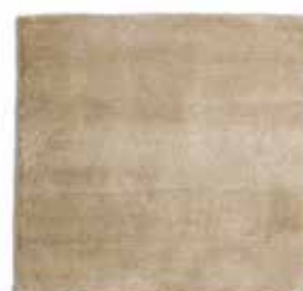
Natural / Natural