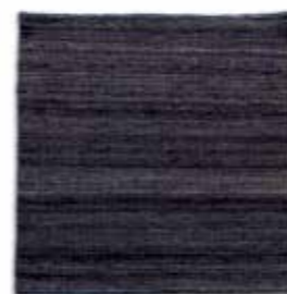
Negro / Black