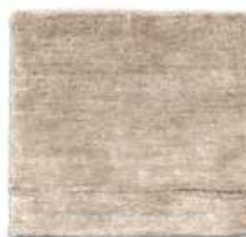
Natural / Natural