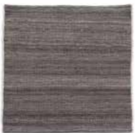
Gris / Grey