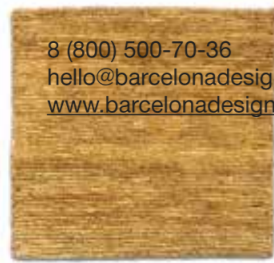
Ocre / Ocher