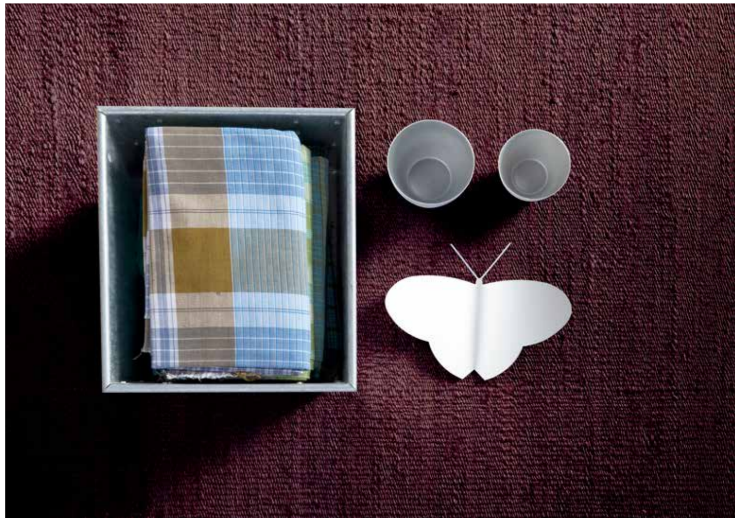
Marrón / Brown