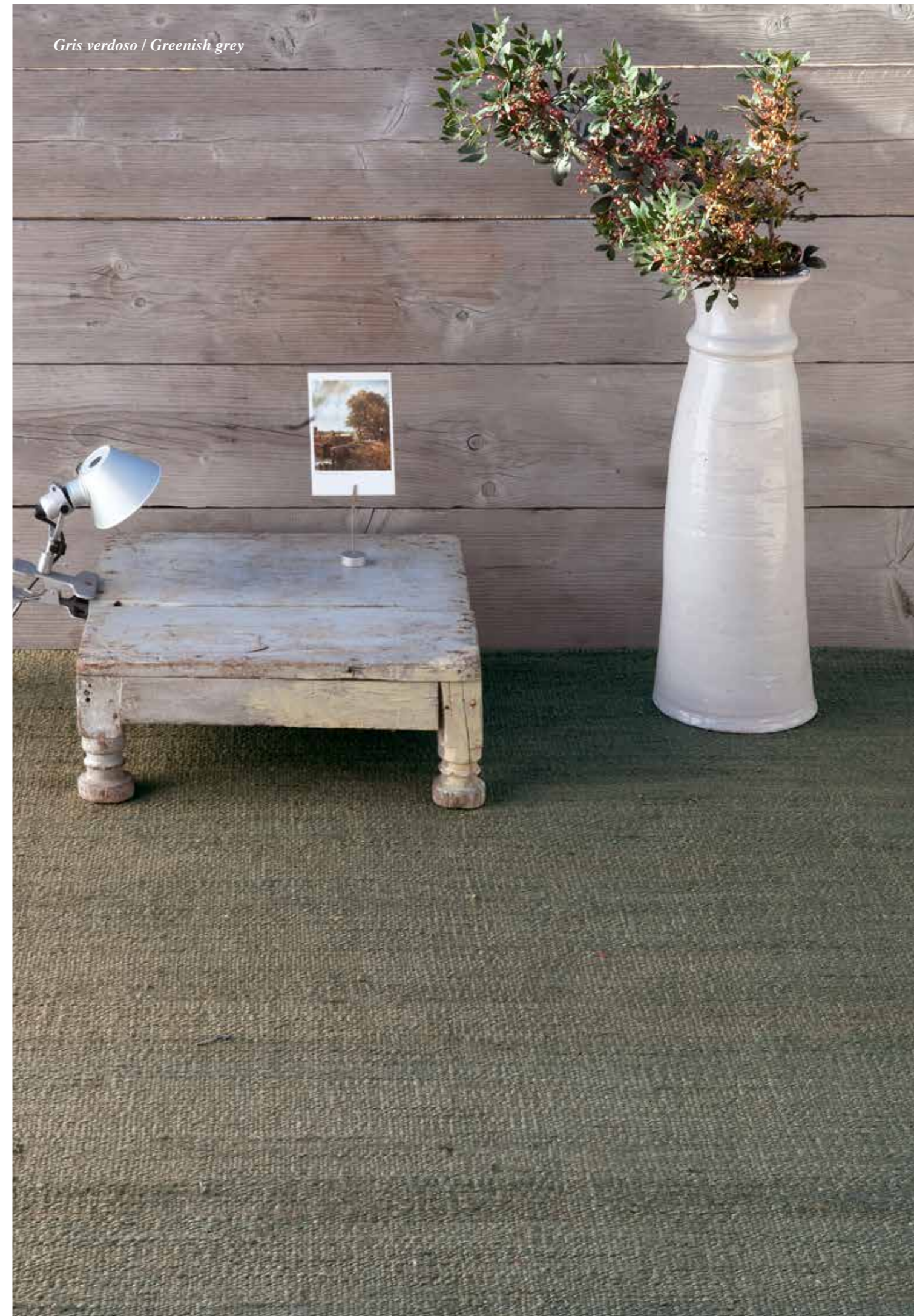
Gris verdoso / Greenish grey