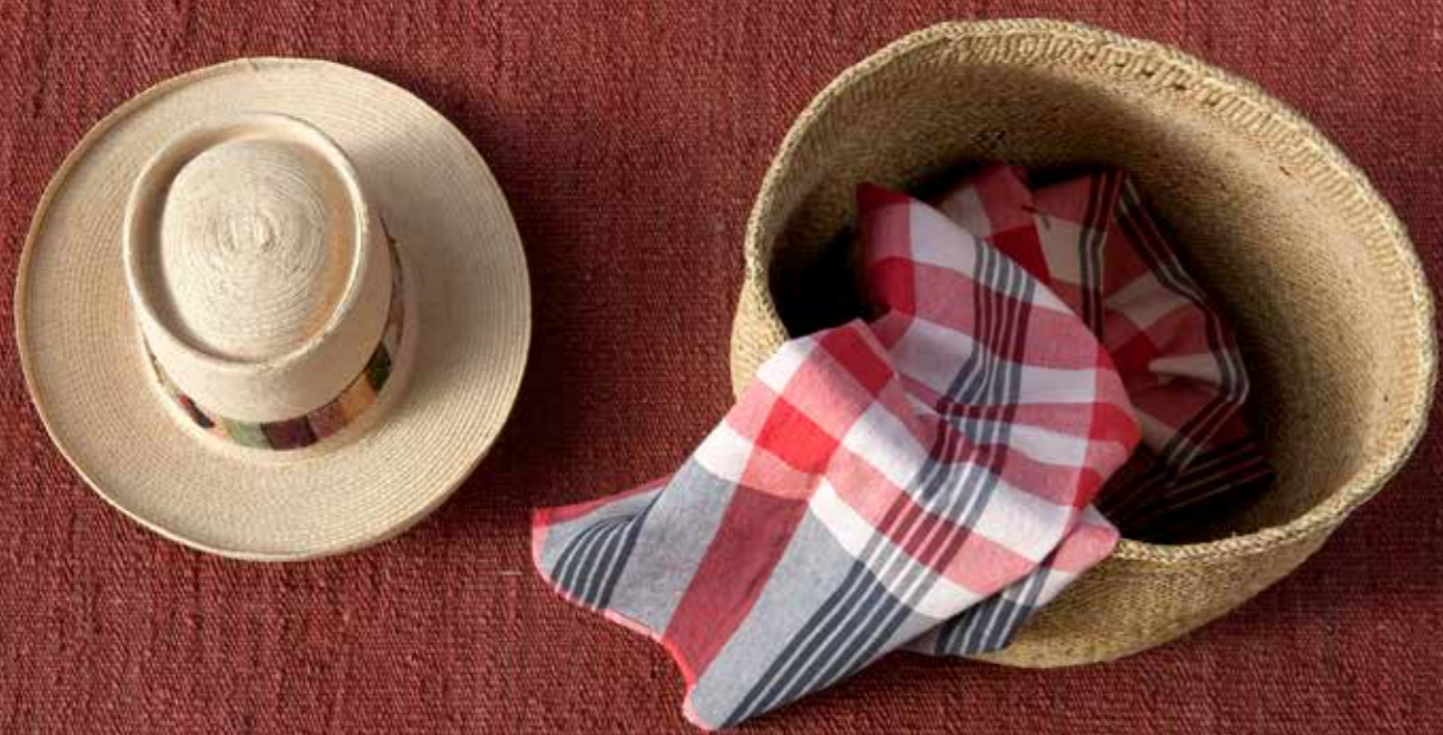
Granate / Garnet