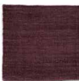
Marrón / Brown