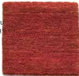
Terracota / Terracotta