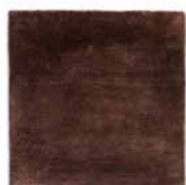
Chocolate / Chocolate

Todas nuestras alfombras están hechas a mano, por lo que se pueden apreciar variaciones de color entre ellas y las muestras del catálogo debido al proceso artesanal. Esto las hace aún más únicas. Estas variaciones de color pueden ser debidas a las características propias de la fibra vegetal o a otros efectos.