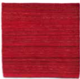
Grana / Deep red