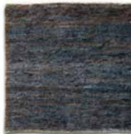
Azul / Blue