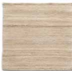
Natural / Natural