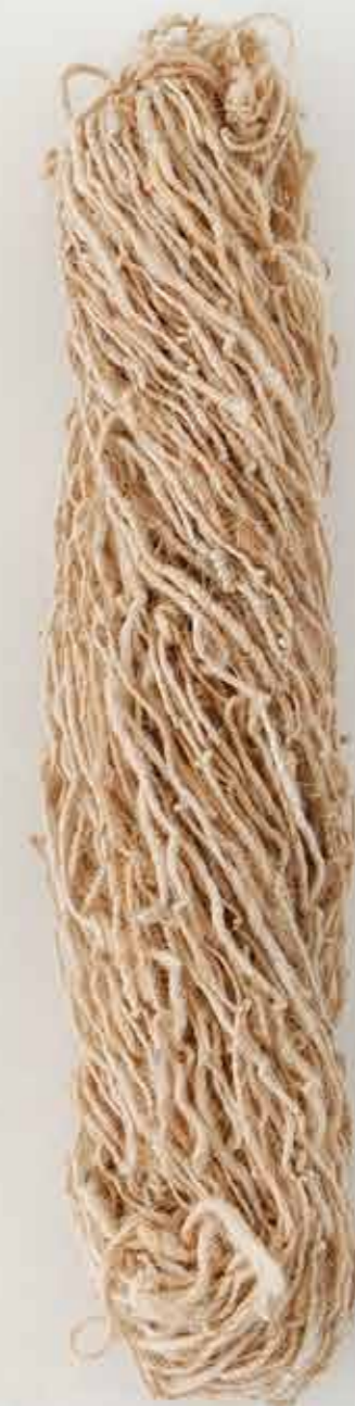
Lana afgana / Afghan wool