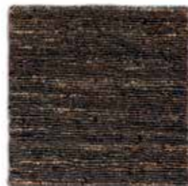
Negro / Black